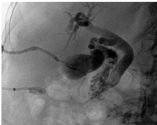
Fig. 1: Colangiografia transepatica: calcolo nel coledoco distale e dilatazione del coledoco e delle vie biliari intraepatiche.

Altrettanto rapida è stata la risoluzione del quadro clinico e il controllo radiologico a sette giorni dalla precedente procedura interventistica rilevava integrità del-