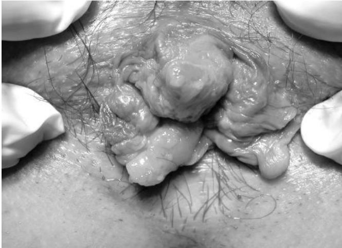
Fig. 1: Emorroidi di IV grado. Preoperatorio.